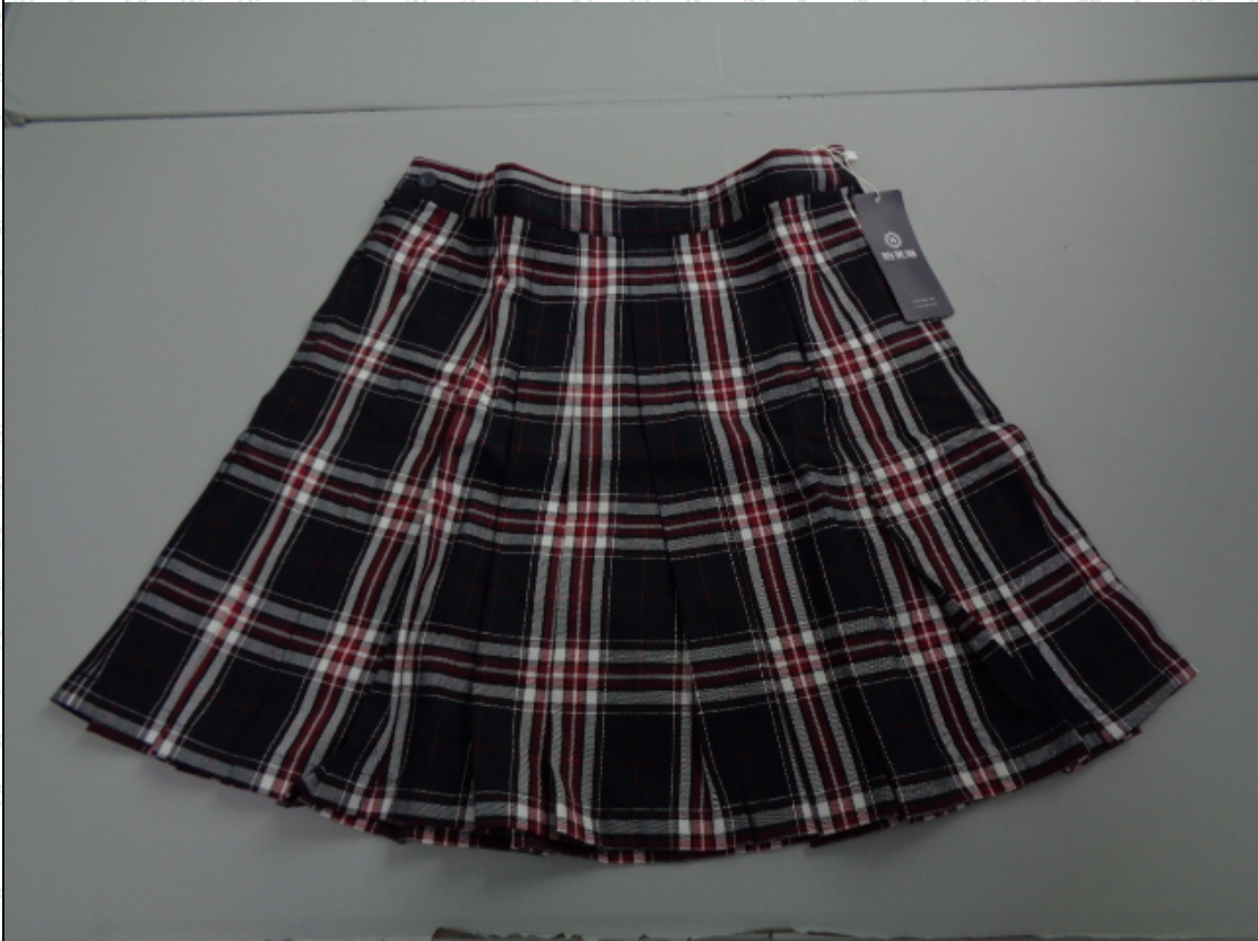
藏青/红/白色格子短裙